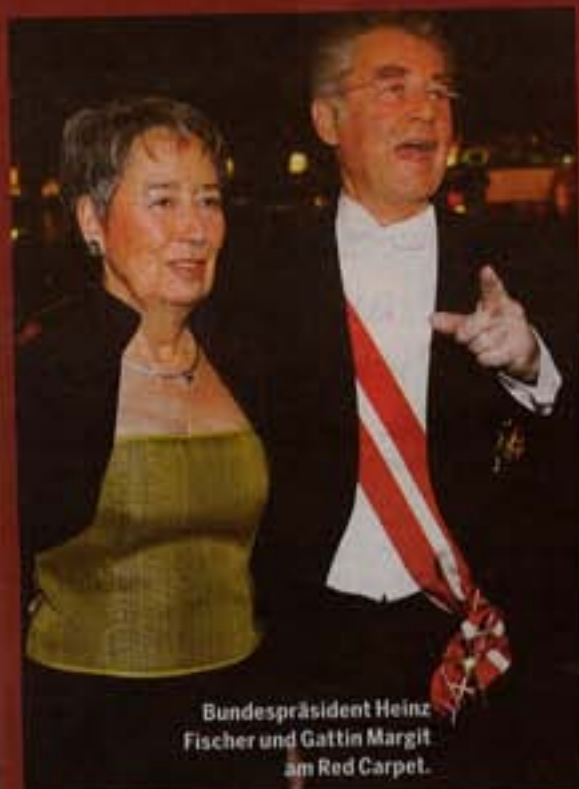
Bundepsäsident Heinz Fischer und Gattin Margit am Red Carpet.