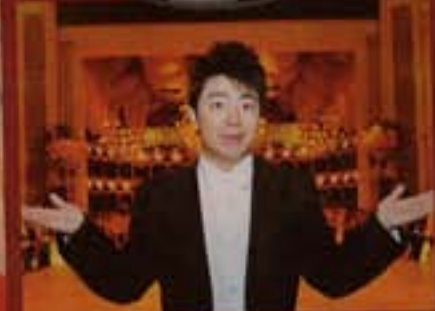
Starpianist Lang Lang war von Elina Garancas Auftritt begeistert.