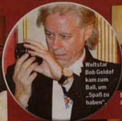
Weltstar Bob Geldof kam zum Ball, um „Spaß zu haben“.