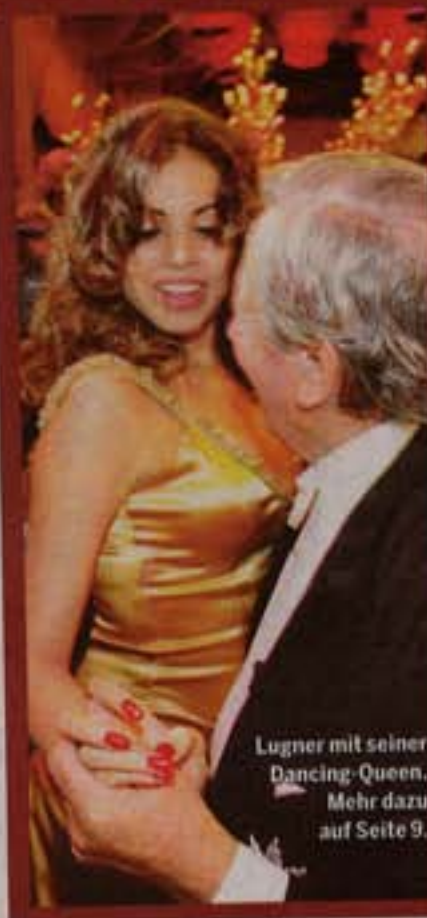
Lugner mit seiner Dancing-Queen. Mehr dazu auf Seite 9.

Sie alle erlebten eine feurige Mitternachtseinlage. Richard Lugner lud Ruby aufs Tanzparkett. Und im Unterschied zu bisherigen Lugner-Gästen ließen es die beiden so richtig krachen.